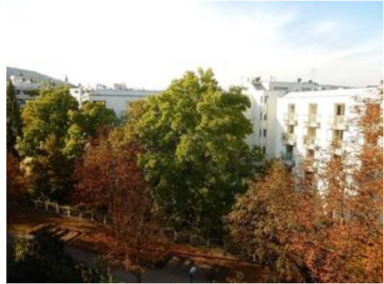
Blick von der Terrasse