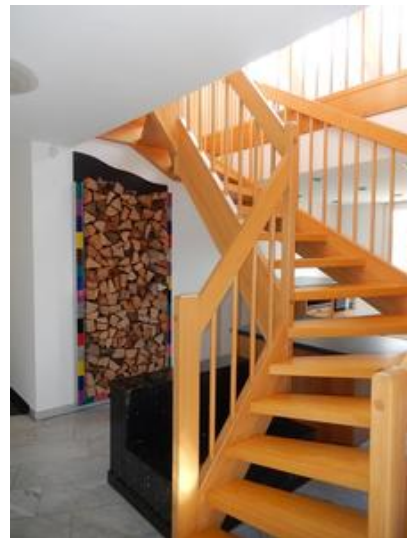
Aufgang zur Galerie