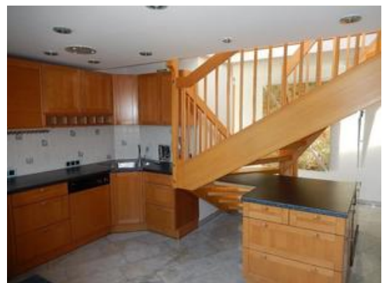
Stiege zum Galeriezimmer